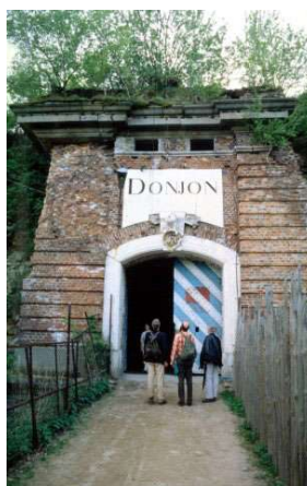
▶ Tor zur Niederbastion

Dieser Bautyp wurde von Friedrich dem Großen bei der Festung Silberberg wieder aufgegriffen. Da die Festung heute stark zugewachsen ist, gibt es keine Gesamtansicht des Donjons, eines mehrstöckigen, mit Artilleriekasematten versehenen Turmes.