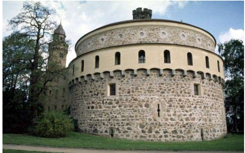
▲ ▼ Görlitz: Artillerierondell „Kaisertrutz“ aus dem Jahr 1490

Vom 29. April bis zum 07. Mai 2001 fand eine Exkursion der DGF nach Schlesien und Krakau statt. Besucht wurden dabei Görlitz, Glatz, Neisse, Silberberg, Breslau, Krakau, Kosel und Schweidnitz. Neben etlichen anderen Sachen konnte dabei auch die Entwicklung des Artillerieturmes vom Ende des 15. Jahrhunderts bis zur Mitte des 19. Jahrhunderts an ausgewählten Beispielen verfolgt werden.