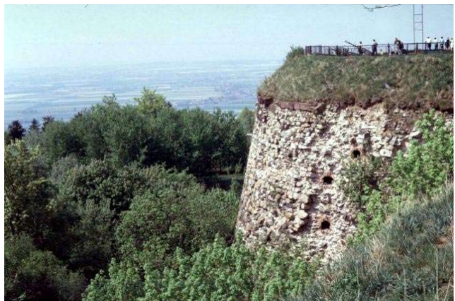
◀ ▼ Artillerierondell „Kaisertrutz“ aus dem Jahr 1490

Dieser Bautyp wurde von Friedrich dem Großen bei der Festung Silberberg wieder aufgegriffen. Da die Festung heute stark zugewachsen ist, gibt es keine Gesamtansicht des Donjons, eines mehrstöckigen, mit Artilleriekasematten versehenen Turmes.